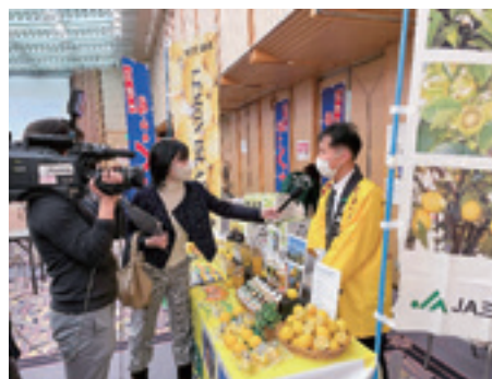
▲地元の食をPRする職員

広島市内の会場で2月28日、広島県とJAグループ広島が主催する、メディア・バイヤー向けの県産食材をPRするイベントが開催されました。G7広島サミット開催に向け、広島県産の食材の魅力を多くの方に知ってもらうことが目的です。各JA・連合会・加工業者などが参加し、各地域の自慢の農産物や特産品をPRしました。 当日は、せとだエコレモンと柑橘加工品をイチオシ食材として紹介しました。メディアや加工業者などが興味を持ち実際に商談につ