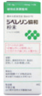
ブドウの種なし処理に利用するジベレリン

品種により、処理濃度・適期が異なります。また、ジベレリンが十分に吸収されるには、処理後高湿度の方が高い効果が得られます。なお、品種ごとのジベレリン処理時期については、最寄りのアグリセンターにてご確認ください。