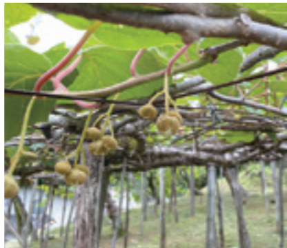
キウイの花…側花を落とし、真ん中の花を残します。