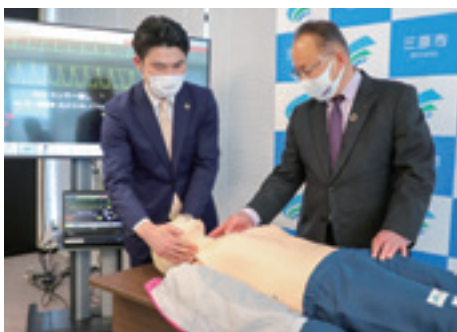
▲救急訓練人形のデモンストレーションを行う岡田市長(左)

J Aは地域貢献活動の一環として、三原市・尾道市・竹原市に防災用品を寄贈しました。 救急訓練人形のデモンストレーションを行ない、使い方や手順などを確認しました。三原市では2022年、救急出動件数が過去最多の5,621件(前年比59.6件増)となり、岡田市長は「救急救命士、救急隊員の観察・処置の技術向上のため活用し、救命率の向上を目指す」と感謝しました。